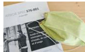
Masque UNS de catégorie 2 (Efficacité > 70%)

OU d'un dispositif de protection personnelle adapté